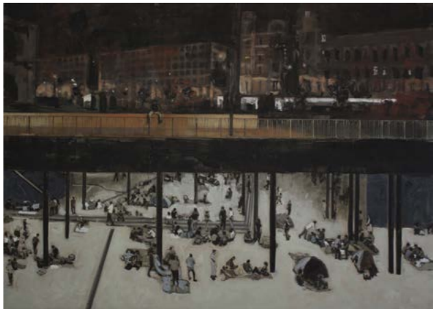
Tvorba fresky zobrazující město 2015 olej na plátně